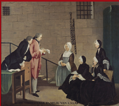
La malheureuse famille Calas, d'après Carmontelle