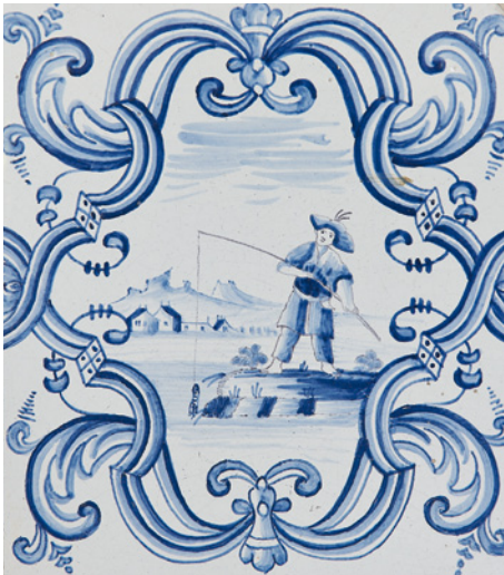
Poêle en faïence, détail

Le vestibule est une des pièces du château remaniée au XIX e siècle. Il conserve deux faux poêles de faïence commandés par Voltaire en 1777, venant probablement des manufactures de Nyon en Suisse. Deux étroits corridors assurent de part et d'autre du vestibule la desserte des diverses pièces du rez-de-chaussée par les domestiques, exception faite des ailes ajoutées en 1765 par Léonard Racle. La dernière famille propriétaire, les David-Lambert, y a réuni au XIX e siècle, malgré leur inimitié connue, les statues de Voltaire et Rousseau en tant que précurseurs des idées des Lumières. L'escalier d'honneur menait à l'étage réservé aux hôtes de Voltaire.