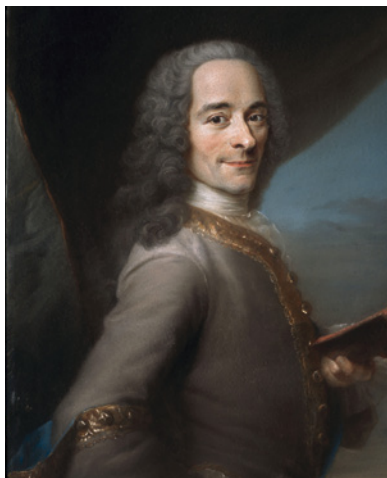
Portrait de Voltaire, par Maurice Quentin de La Tour