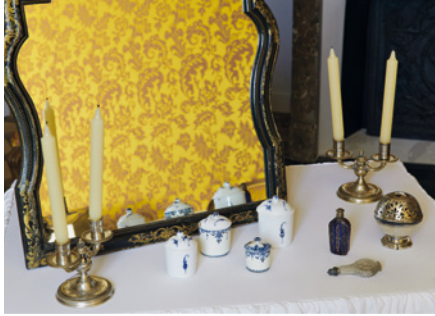
Table de toilette