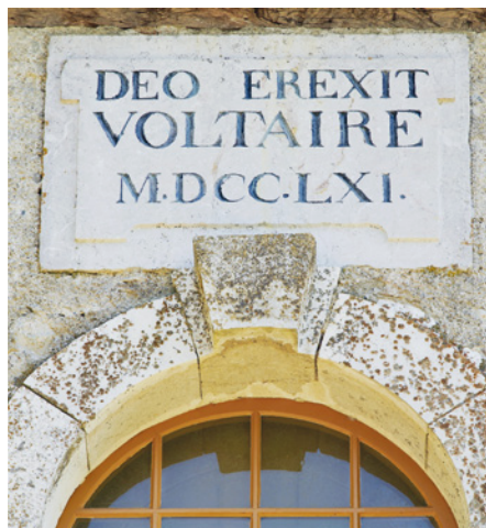
Plaque de l'église «érigée par Voltaire à Dieu - 1761.»

Entre le Jura et les Alpes, Voltaire aime ses jardins qui, pour lui, forment le plus bel ornement du domaine. Au XVIII e siècle, le domaine est ouvert sur le village. La cour d'honneur accueille un théâtre dans une ancienne grange où Voltaire donne des représentations. À l'arrière du château, espace privé, sont aménagés un jardin à la française agrémenté d'une pièce d'eau ainsi que l'allée de la charmille sous laquelle le philosophe se repose et écrit. Il fait planter une vigne, entretient une carpière et fait cultiver potager et verger. Au XIX e siècle, les David-Lambert procèdent à d'importants aménagements : création de l'entrée d'honneur, implantation du parc à l'anglaise à l'ouest, clôture du domaine, etc.