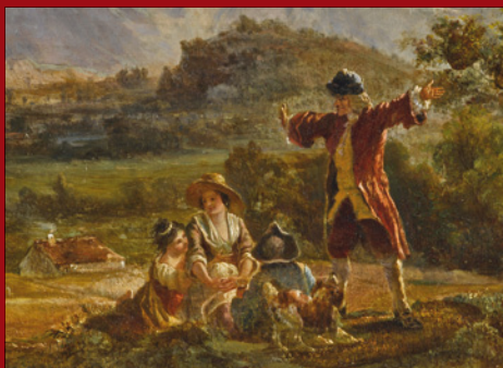
Voltaire accueillant les paysans (détail) par Jean Huber, issu de la Voltairiade

À Ferney, Voltaire va mettre en pratique les principes de sa philosophie. Il dépense beaucoup de temps, d'argent et d'énergie au développement du bourg. Il fait assécher les marais insalubres, fait paver les rues, finance la construction de maisons, d'une fontaine publique, d'un théâtre, etc. Il encourage et diversifie l'artisanat en créant une manufacture de faïence, une tannerie, une fabrique de bas de soie, une manufacture d'horlogerie. Il porte un grand intérêt à l'agriculture, introduit de nouvelles cultures et dote les paysans d'outils. Mais son engagement ne s'arrête pas là. Depuis Ferney, le philosophe mène de grandes batailles contre «l'Infâme», son expression pour désigner l'injustice, l'intolérance et le fanatisme religieux. C'est le temps des affaires judiciaires et de la mobilisation de l'opinion publique. La figure de Jean Calas en est la plus célèbre. Voltaire engage, en la faveur de ce protestant toulousain accusé d'avoir assassiné un de ses fils pour empêcher sa conversion au catholicisme, une retentissante campagne dans l'Europe entière qui aboutit à sa réhabilitation. Mais bien d'autres suivront avec les affaires Sirven, du chevalier de la Barre, des serfs du Jura ou de Lally-Tollendal pour lesquelles Voltaire lutte jusqu'à ses derniers jours.