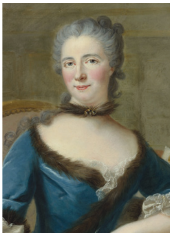
Portrait de M me du Châtelet, détail, par Marie-Anne Loir