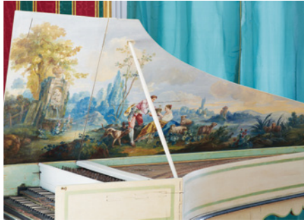
Clavecin, Nicolas Gosset, 1770